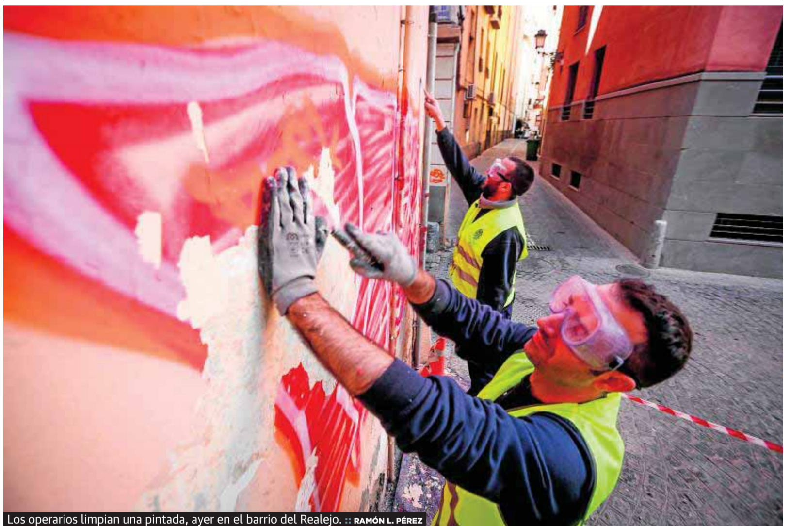
Los operarios limpian una pintada, ayer en el barrio del Realejo.